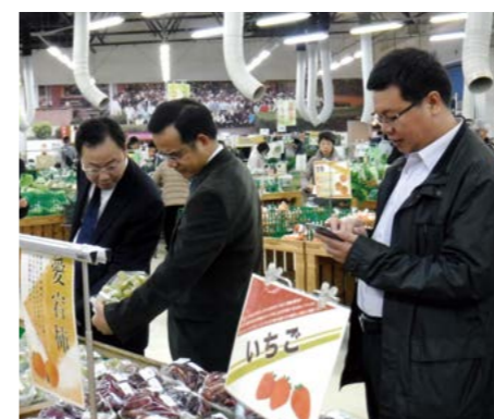
産直市場を視察する参加者

地方自治の現状と課題について意見交換および情報交換を行うとともに、日本の文化などについても理解を深めてもらい地域間交流の契機とすることを目的とした「海外自治体幹部交流協力セミナー」を1997年から実施しています。