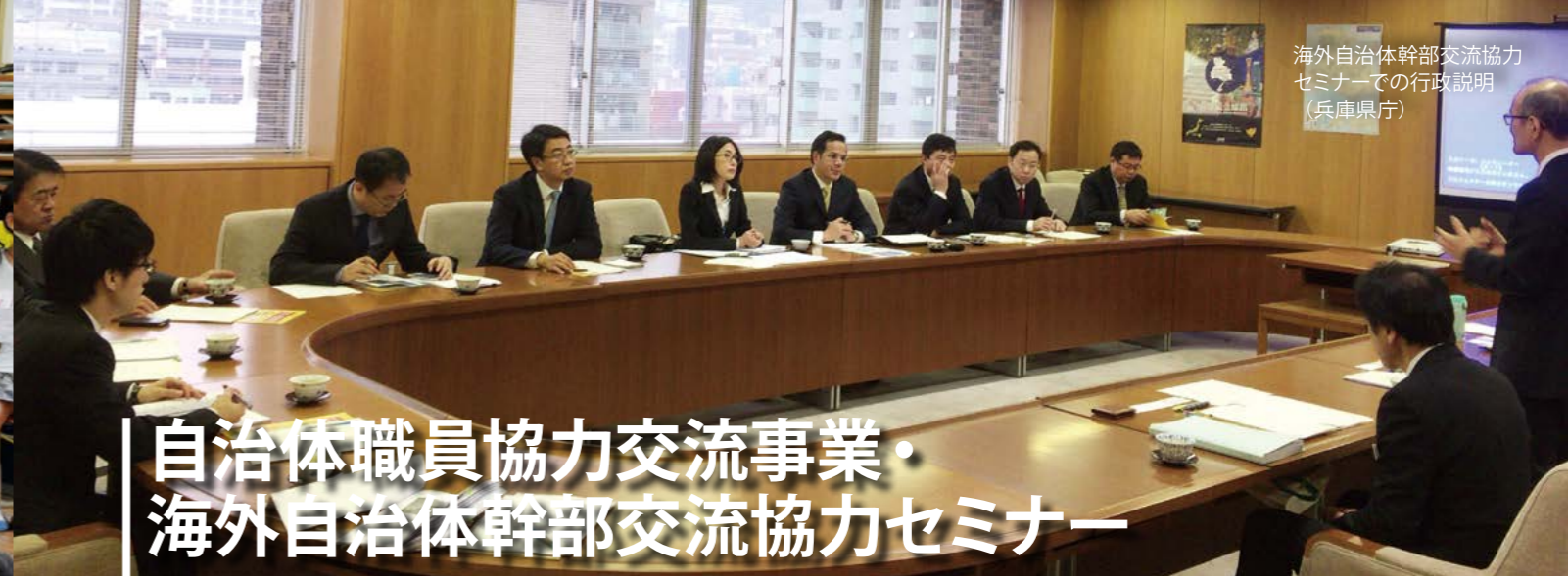
海外自治体幹部交流協力セミナーでの行政説明（兵庫県庁）