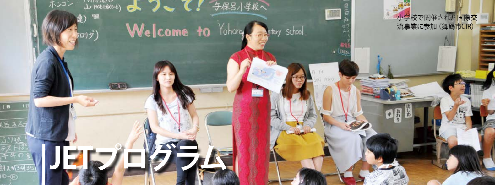
小学校で開催された国際交流事業に参加（舞鶴市CIR）