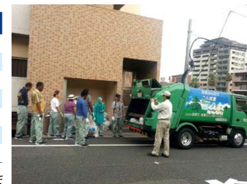
環境分野での研修

友好提携都市間等の交流の一環として幅広く活用され、2018年度までにのべ507人の研修生を派遣しました。