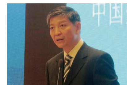
あいさつをする寥力強中国外交部外事管理司長