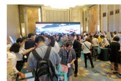
地方自治体と中国旅行社のPR交流会