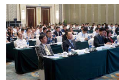
真剣な表情の参加者