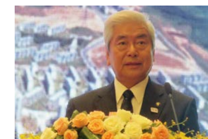
並木心東京都羽村市長による基調講演