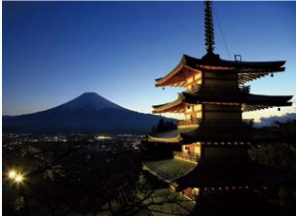
しゃしんでいきょう かんこうすいしん きこう (写真提供：やまなし観光推進機構)