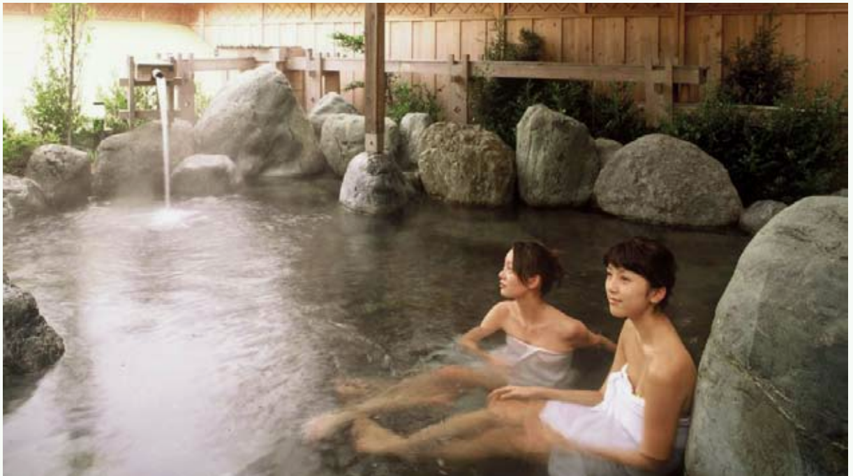
しゃしんていきょう かんこうずいしん きこう (写真提供：やまなし観光推進機構)

河口湖温泉郷位于世界遗产的组成部分之一的河口湖湖畔。这里便于前往富士山观光，一年之中有众多中国团队游客来访。另外，目前正在新建高级旅馆等，它将变身为未来可以满足中国富裕阶层需求的温泉地。