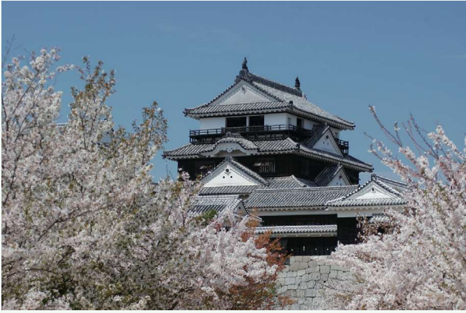
まつやまじょう 松山城 松山城