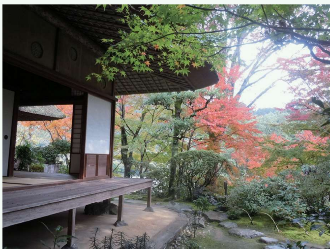
が りゆうさんそう 臥龍山莊 卧龙山庄

在旧街道沿路，从江戸时代末期到明治、大正时期建造的豪华商铺、仓库、民房等建筑物鳞次栉比，这里被选定为国家重要传统建筑物群保留地区。护国街道至今仍有居民生活着，在这片洋溢着生命力的街道上，令人舒适的气息充满整个街区，漫步街头，仿佛时间都放慢了脚步。各式建筑汇聚了独特的建筑装饰，人们可以在这里充分地感受富于设计性的造型之美。