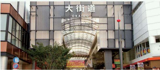
おおかいどうしょうてんがい 大街道 商店街 大街道商店街