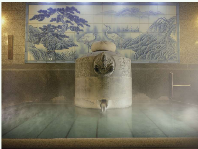
どうごおんせんべっかん あすかのゆ 道後温泉別館・飛鳥乃湯泉 道后温泉別館・飛鳥乃湯泉

古时，道后温泉便曾在《古事记》和《万叶集》中登场，被称作日本最古老的温泉。雅致的城郭式木结构三层楼本馆的整栋建筑物都是国家重要的文化财产。以《少爷》为代表，在诸多著名的小说和电影作品中，道后温泉作为松山的标志性建筑时有登场。享受过肌肤触感滑润的名温泉之后，换上浴衣在氤氲着文化气息的道后街道上信步闲逛，更添一番温泉情趣。如今，道后温泉一边营业，一边在进行保护修缮工程。