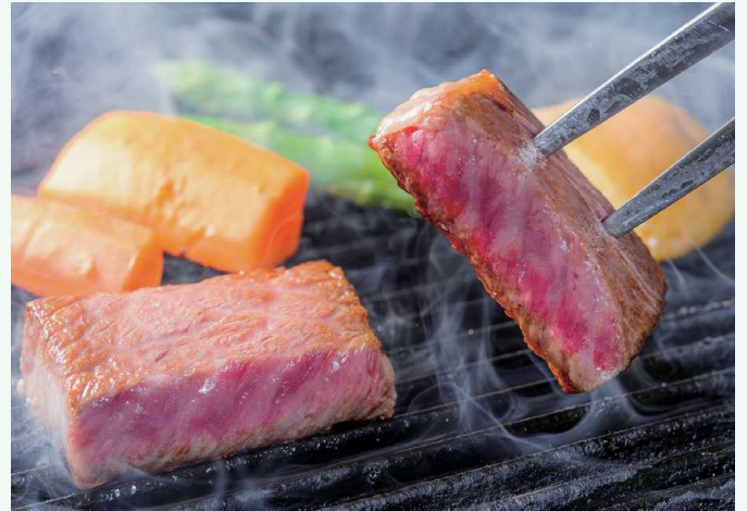
おおいた豊後牛のステーキ 大分豊后牛牛排

大分豊后牛是在大分得天独厚的自然环境中养育出的牛，其牛肉是拥有辉煌的历史与实绩的杰作。特色是拥有细腻的脂肪纹理，风味醇厚、入口即化。左右肉牛