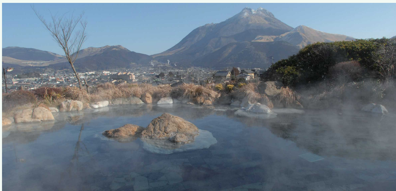
ゆふだけ のぞ だいろてんぶろ 由布岳を望む大露天風呂 能眺望由布岳的大露天温泉

由布院温泉在日本全国都拥有超高的知名度，是一个备受人们青睐的温泉地。在超过900处的泉源中，每分钟约有49000升温泉水喷涌而出。有了被称为“丰后富士”的由布岳等美丽的大自然环绕，在山间度过的恬静时光能让人身心逐渐放松下来。