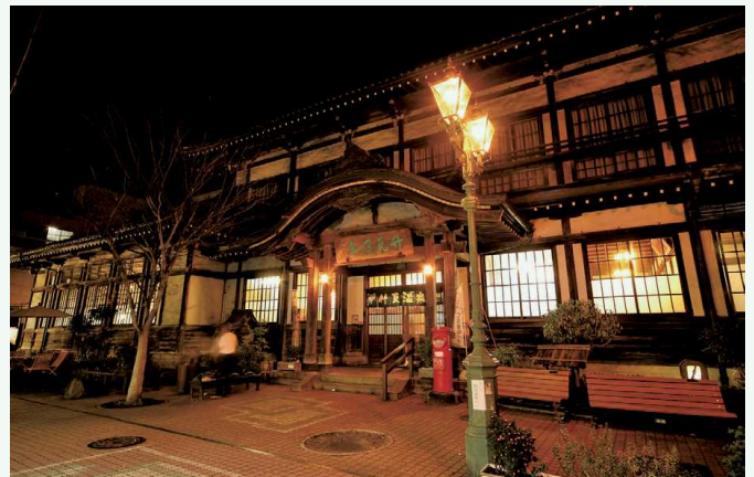
べつ ぶ たけがわらおんせん 別府「竹瓦温泉」 别府“竹瓦温泉”

せかいゆうすう おんせん ち べつ ぶ し べつ ぶ みょうばん 世界有数の温泉地である別府市には、別府・明礬・ かなわ はまわき かめがわ かんかい じ ほつ た しばせき おんせん 鉄 輪・浜脇・亀川・観海寺・堀田・柴石の8つの温泉 きょう そうしょう べつ ぶ はつとう よ 郷があり、総称して「別府八湯」と呼ばれています。 おな し ない せんしつ けい かん こと 同じ市内でもエリアごとに泉質や景観が異なり、それ おもむき あじ ぞれの趣を味わうことができます。