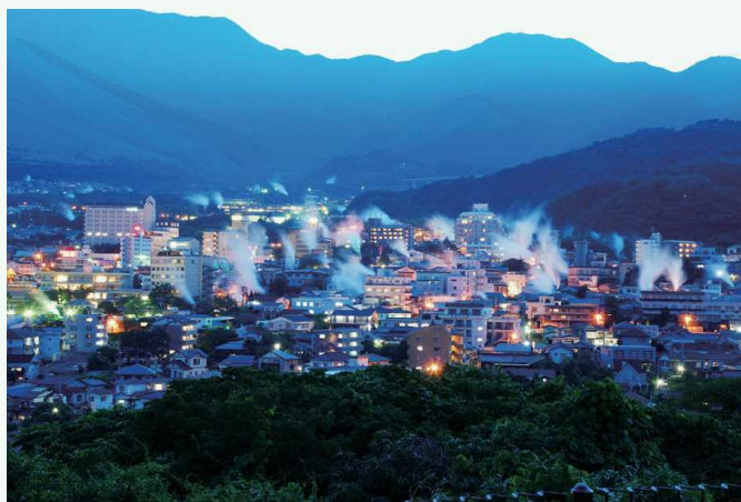
湯けむりが美しい別府の眺望 远眺有着唯美温泉蒸气的别府

别府因温泉水涌出量之丰富、泉源数量之多而闻名，到处升腾着白色的温泉蒸气。这一特色景观还入选为国家重要文化景观。在位于铁轮地区的温泉蒸气眺望