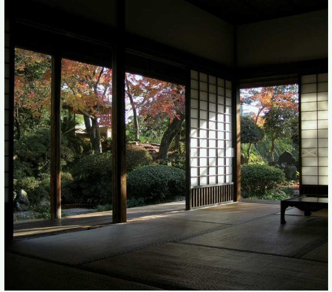
ぶ け やしき おおはらてい 武家屋敷「大原邸」 武家宅邸“大原邸”

在杵築的城下町，南北高地上武家宅邸鳞次栉比， 宅邸间的夹缝处由町屋衔接左右，这种三明治型的城下 町即便在日本也十分罕见。江戸时期风情犹存的石阶坡 道和白墙点缀的风景在电影和电视剧中也时有登场。