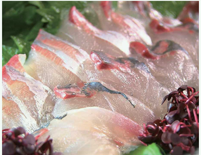
せき せき さしみ 関あじ・関さばの刺身 关竹荚鱼、关青花鱼的刺身

关竹荚鱼、关青花鱼是大分在日本全国引以为豪的品牌鱼。濑户内海与太平洋的海水相互追逐拍打，在这片被称为速吸濑户的海域，海流速度快，饵料丰富，一竿一条钓上来的竹荚鱼和青花鱼肉质紧实，浓缩了美味，将其制成刺身的吃法非常值得一试。