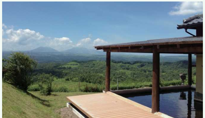
こうげん のぞ くじゅうこうげん 高原を望む久住 高原コテージ 能眺望高原的久住高原山庄

从城下町的温泉、历史悠久的沿河露天温泉，到能眺望到雄伟高原的温泉等，奥丰后的温泉种类十分丰富。自古以来，平民自不必说，藩主与文人墨客也对此知名的温泉之乡青睐有加。这里还有在日本也十分罕见的高浓度碳酸泉“汽水温泉”，一泡入温泉身体就会沾满气泡。