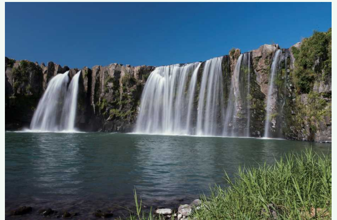
原尻の滝 はらじり たき 原尻瀑布

原尻瀑布是入选“日本瀑布百选”的著名瀑布。9万年前，阿苏火山大喷发中产生的火山碎屑流堆积了数十米，冷却凝固时形成了这个罕见的大瀑布。瀑布宽