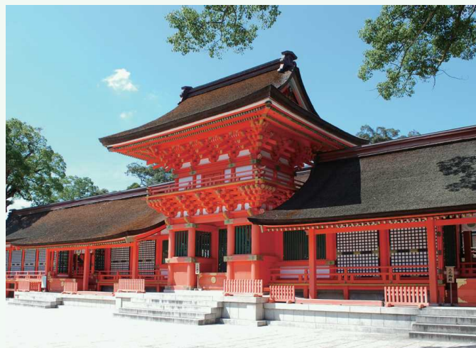
う さじんぐうちよくしもん 宇佐神宮 勅使門 宇佐神宮 救使門

宇佐神宮是全国4万余座八幡宮的本宗，它与在国 东半岛流传极广的神佛融合的山岳信仰、六乡满山文化 有着深厚的联系，每年都有许多参拜者来到这里。宽敞 的院内被源于太古时期的原始森林所包围，院内空气清