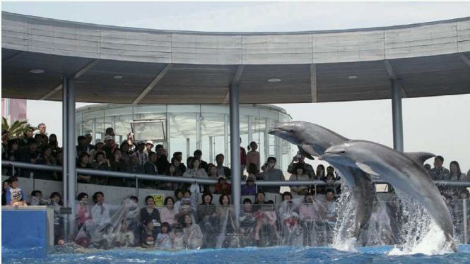
うみたまごのイルカショー 海卵的海豚表演

「うみたまご」は、生命の起源である海にふれ、楽しみながら学べる水族館です。セイウチやイルカなどのショーは家族みんなで楽しめます。自然に近い状態で動物たちと思い切りふれ合える「あそびーち」は子供たちに人気です。隣接する高崎山自然動物園では、野生のニホンザルを観察することができます。