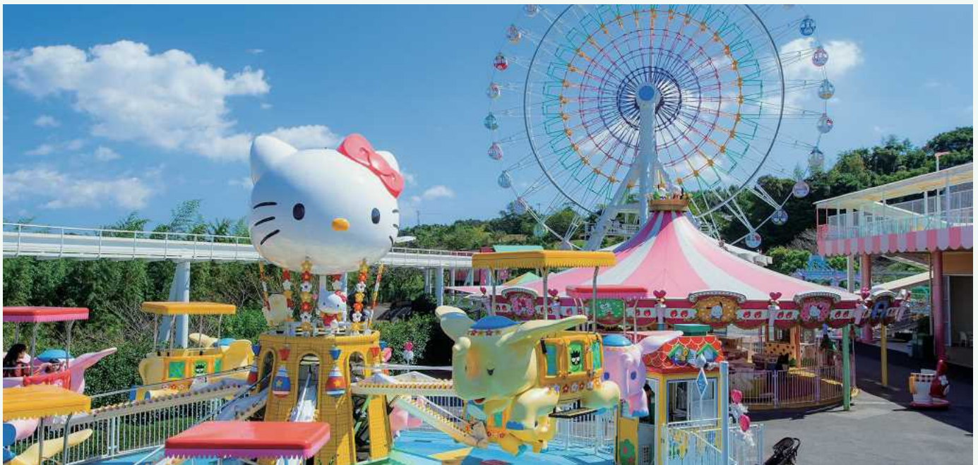
ハーモニーランド 和谐乐园

三丽鸥主题公园在全世界仅有两处，只有这里的和谐乐园是室外型。以三丽鸥卡通形象为主题元素的游乐设施适合全家人一起体验。人气卡通形象出演的现场秀及巡游每天都在上演。舞台设置了顶棚，因此雨天也能体会到表演的乐趣。