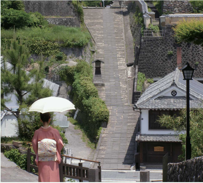
す や さか 酔屋の坂 酔屋坡道

きつき じょう かまち なんぼく たかだい ぶ け やしき なら 杵築の城下町は、南北の高台に武家屋敷が並び、そ はざま まち や のき つら にほん めずら の狭間に町屋が軒を連ねる、日本でも珍しいサンド イッチ型の城下町です。江戸時代の風情が残る石畳の がた じょう かまち えど じだい ふぜい のこ いしだたみ 坂道や白壁が彩る風景は、映画やドラマにもたびたび さかみち しらかべ いるど ふうけい えい が 登場しています。