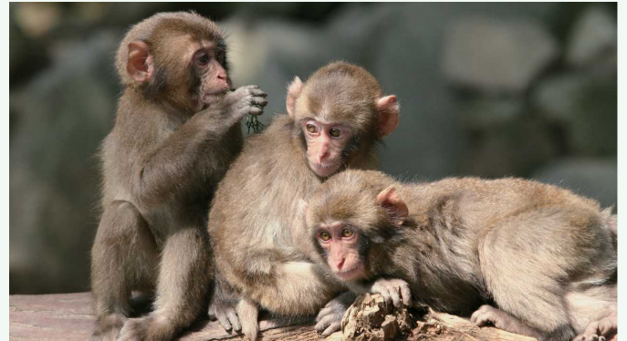
うみたまごに隣接する高崎山自然動物園 与海卵相邻的高崎山自然动物园

“海卵”是一个能体验大海这个生命起源之地，并寓教于乐的水族馆。海象及海豚等表演适合全家人一起观赏。在接近自然的状态下与动物们尽情互动的“玩乐沙滩”很受孩子们欢迎。在相邻的高崎山自然动物园中，人们可以观察到野生的日本猕猴。