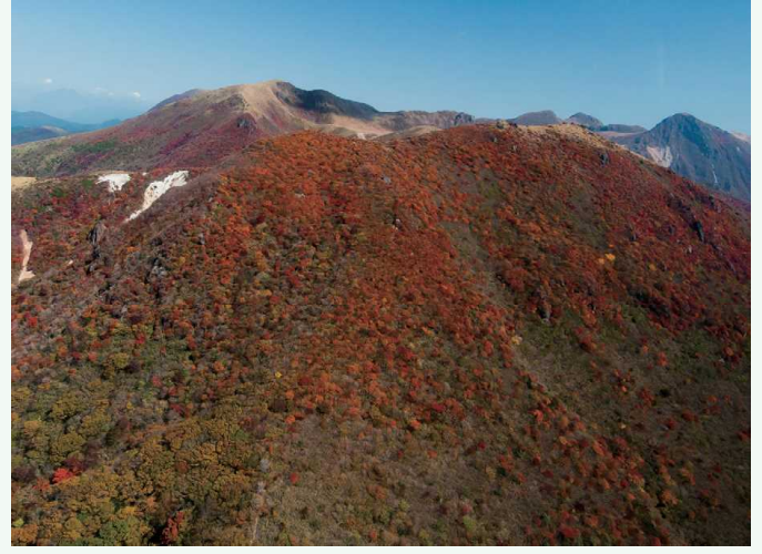
紅葉の季節 こうよう きせつ 紅葉的季节

九重连山从玖珠郡九重町一直绵延到竹田市北部，海拔约为1700米的群山绵亘，也被称为“九州的山脊”。5月下旬至6月中旬期间，九州山杜鹃花将山顶染成粉色，而到了秋天，鲜艳的红叶如同在山上铺了层地毯般为群山添彩，让登山客乐而忘返。