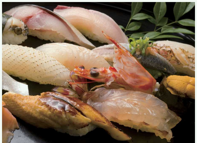
さいきすし 佐伯寿司 佐伯寿司

以里亚斯型海岸为特征的丰后海峡是日本屈指可数的的优质渔场。使用经受过惊涛骇浪锤炼的极鲜海鱼、并由技艺娴熟的寿司师傅捏制出的寿司，其店铺在佐伯市