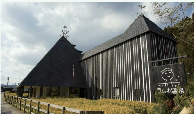
おんせんかん ラムネ温泉館 汽水温泉馆

じょう かまち おんせん かわぞ れきし ろてんぶろ ゆうだい 城下町の温泉や川沿いの歴史ある露天風呂、雄大 こうげん のぞ おんせん おくぶんご おんせん しゆるい ほうふ な高原を望む温泉など、奥豊後の温泉は種類が豊富で むかし しまみん はんしゅ ぶんじんぼつかく あい す。昔から、庶民はもちろん、藩主や文人墨客にも愛 されてきた名湯の里です。入ると体に気泡がつくほどの めいとう さと はい からだ きほう の、日本でも珍しい高濃度炭酸泉「ラムネ温泉」もあります。