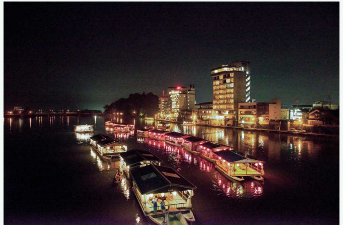
ひ た みくまがわ ゆうせん 日田三隈川の遊船 日田三隈川の游船

日田自古以来被称为“水乡”，河畔的温泉旅馆错落有致。这里还有天之籟温泉的公共露天温泉等，能给人带来仿佛浸泡在河川中的感觉。出浴之后落座屋形船中，来自河川的凉风令人感到舒适惬意，人们可以在此享受品尝美食等乐趣。