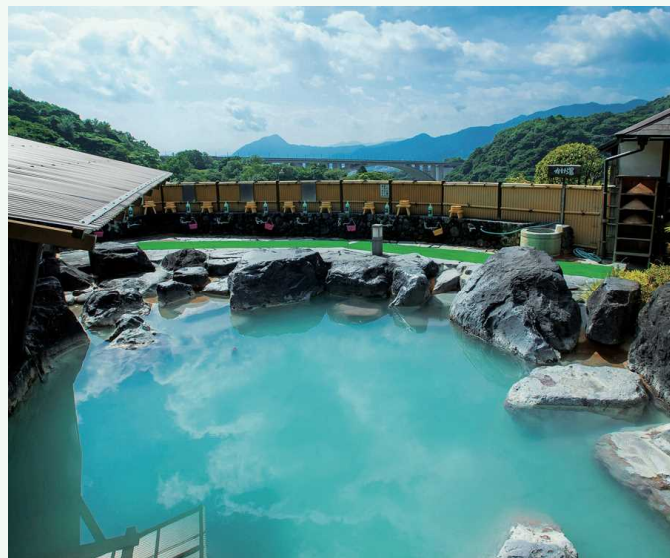
みょうぼんおんせん 明礬温泉 明矾温泉

在世界上屈指可数的温泉地别府市，坐落着别府、明矾、铁轮、浜胁、龟川、观海寺、堀田、柴石八大温泉乡，它们被称为“别府八大温泉”。虽然地处同一个市内，但每个区域的泉质与景观都各有差异，人们可以尽享各色情趣。