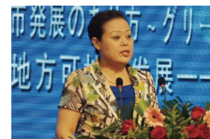
中国外交部外事管理司杜德文副司长致辞