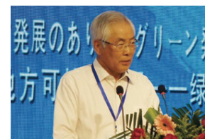
北岛市长上野正三发表主旨演讲