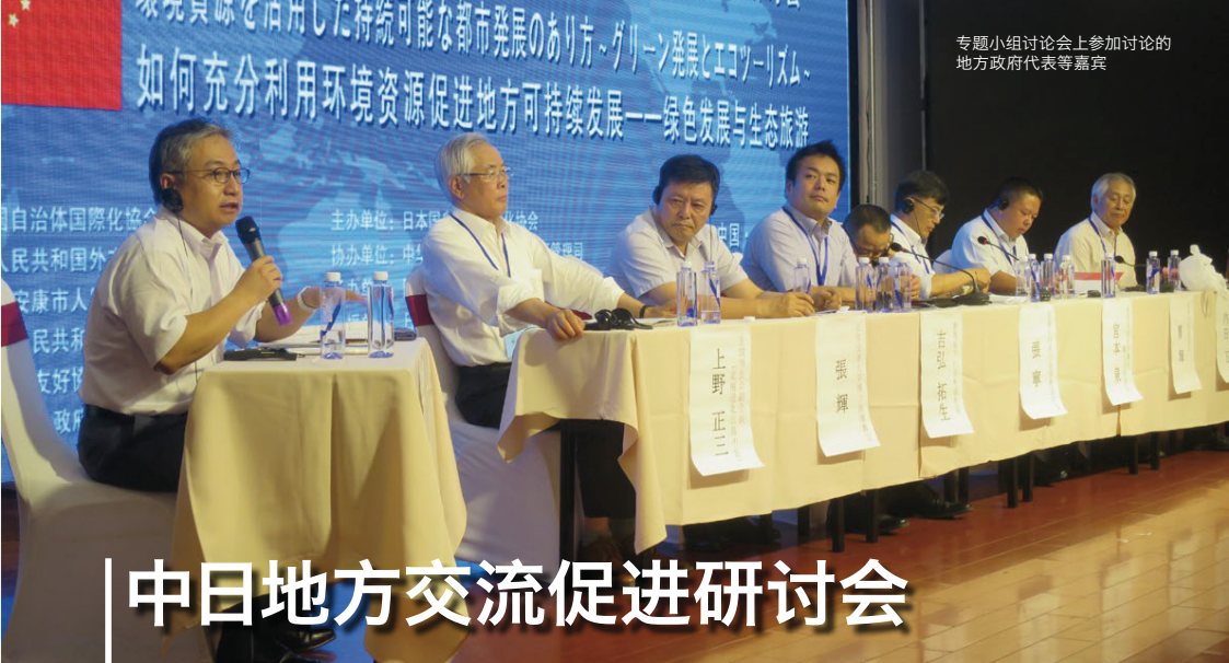
专题小组讨论会上参加讨论的 地方政府代表等嘉宾